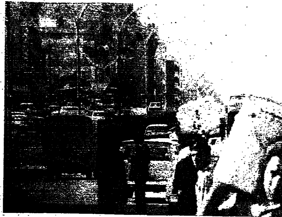
حركة سير وشاحنة حطين نسي كورنيش الزرعة